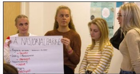
FRAMFORING: Då plakatane var laga stod gruppene foran resten av klassen med ideane sine. Noko av det dei foreslo var tilrettelegging av turmål for alle, appar og målretta og grundig informasjon.

Prosjektet i Dovre og Dombås starta for fullt i 2018 og skal vere ferdig i desember 2020. Det er eit samarbeid mellom Norsk institutt for naturforskning (NINA), Østlandsforskning og Høgskolen i Innlandet. Til saman utgjer dei Sentraler